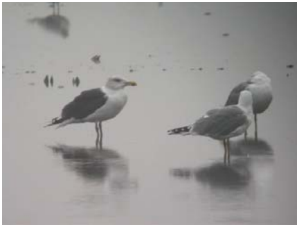
Dolmányos sirály ( Larus marinus ) 2004. november 7 – 14. Balmazújváros