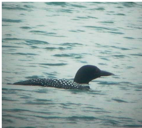
Jeges búvár ( Gavia immer ) 2004. június 6 – 7. Kiskunlacháza

2004. június 6–7. Kiskunlacháza, bányató 1 ad. (nászruhás) pld. (Horváth G., Szabó Z., Ungi B. és mások);