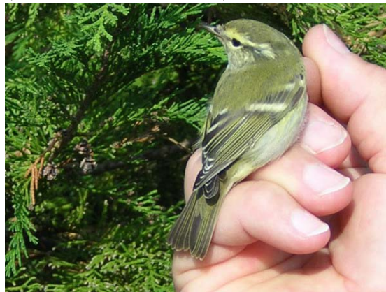
Vándorfűzike ( Phylloscopus inornatus ) 2004. október 3.