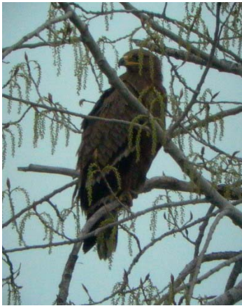
Pusztai sas ( Aquila nipalensis ) 2004. április 6 – 9. Jászberény

2004. április 6–9. Jászberény, Gyékényes-dűlő 1 imm. (2y) pld. (Zalai T. és mások);