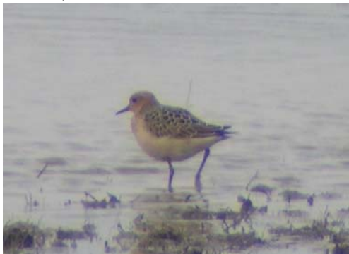
Cankópartfutó ( Tryngites subruficollis ) 2004. szeptember 25. – október 7. Apaj

2004. szeptember 25. – október 7. Apaj, Ürbői-halastavak 1 juv. (1y) pld. (Berényi Zs., Lendvai Cs. és mások);