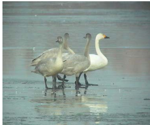
Kis hattyú ( Cygnus columbianus ) 2004. november 28 – 29. Székesfehérvár