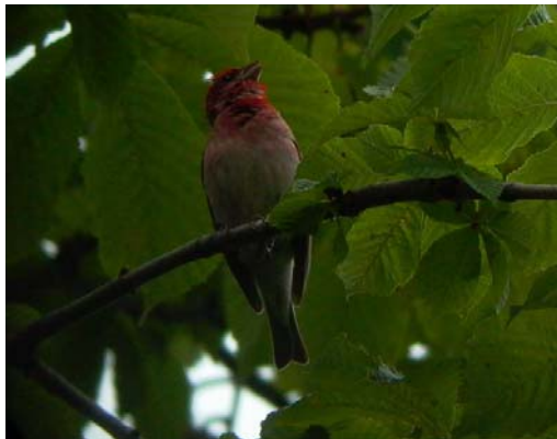
Karmazsinpirók ( Carpodacus erythrinus ) 2004. július 2 – 19. Tapolca

2004. június 8. – július 11. Tállya, Nagy-Bányász 1 ad. (nászruhás) hím pld. (Petrovics Z. és mások);