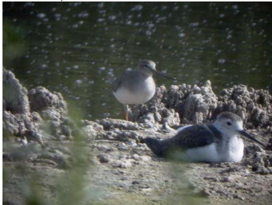
Terekcankó ( Xenus cinereus ) 2004. augusztus 12 – 15. Kaba