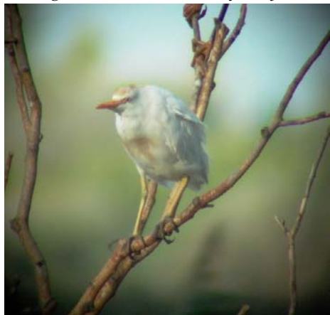
Pásztorgém ( Bubulcus ibis ) 2004. augusztus 14 – 19. Tömörkény

2004. augusztus 14–19. Tömörkény, Csaj-tó 1 ad. pld. (Domján A; Berényi Zs., Fehér F. és mások);