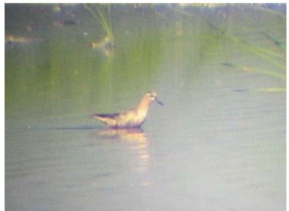
Laposcőrű víztaposó ( Phalaropus fulicarius ) 2004. augusztus 7 – szeptember 5.