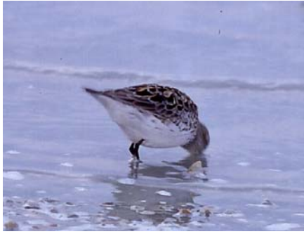
Bonaparte-partfutó ( Calidris fuscicollis ) 2004. május 9 – 10. Fertőújlak

2004. május 9–10. Fertőújlak, Borsodi-dűlő 1 imm. (2y) pld. (H. Spinler; Pellinger A., Dorogman Cs.);