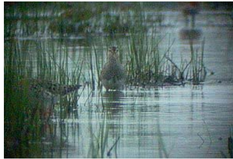
Vándorpartfutó ( Calidris melanotos ) 2004. április 30. Egyek (fotó: ifj Oláh János)

2004. augusztus 6. Fertőújlak, Borsodi-dűlő 1 ad. pld. (Pellinger A., Ferenczi M., Makk K.; Hadarics T; Molnár B.);