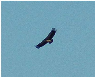
Fakó keselyű ( Gyps fulvus ) 2004. szeptember 11. Hortobágy

2004. szeptember 11. Hortobágy, Nyíró-lapos 1 ad. pld. (Gyüre P., Nehézy L.; Szilágyi A.);