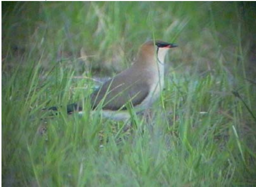
Feketeszárnyú székicsér ( Glareola nordmanni ) 2004. május 18. Hortobágy

2004. május 18. Hortobágy, Nagy-Vókonya 1 ad. (nászruhas) pld. (Ecsedi Z., Oláh J., Szilágyi A., Tar J. és társaik);