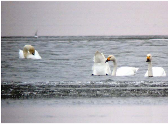
Kis hattyú ( Cygnus columbianus ) 2004. március 5 – 10. Hortobágy

2004. november 28–29. Székesfehérvár, Vörösmarty-halastavak 2 ad. + 3 juv. (1y) pld. (Fodor A. és társai; Hadarics T. és társai);