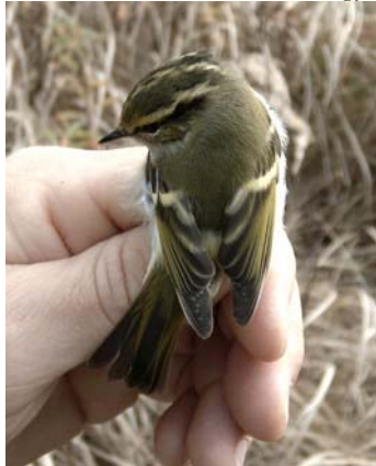
Királyfűzike ( Phylloscopus proregulus ) 2004. november 4. Tömörd

2004. november 4. Tömörd, Nagy-tó 1 pld. (megfogva) (Illés P., Szabolcs A. és társaik);