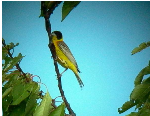
Kucsmás sármány ( Emberiza melanocephala ) 2004. június 8. – július 11. Tállya (fotó: Zalai Tamás)