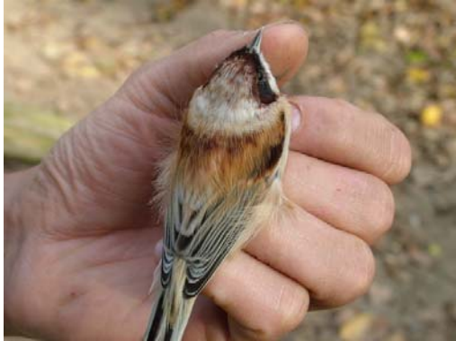
Függőcinege caspius alfaja ( Remiz pendulinus caspius ) 2004. november 11. Izsák

2004. november 11. Izsák, Kolon-tó 1 ad. (nyugalmi ruhás) hím pld. (megfogva) (Németh Á., Lóránt M.);